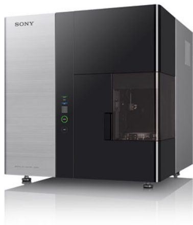
スペクトル型セルアナライザー SA3800